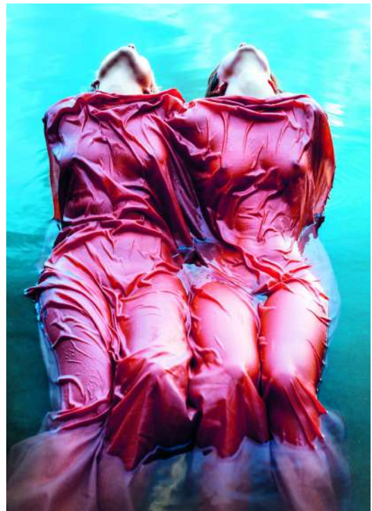
Rencontres de printemps - "Pour que les vents se lèvent".