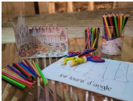
Atelier Croq'patrimoine